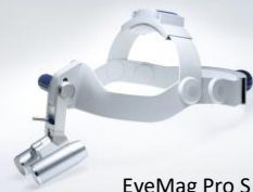
EyeMag Pro S