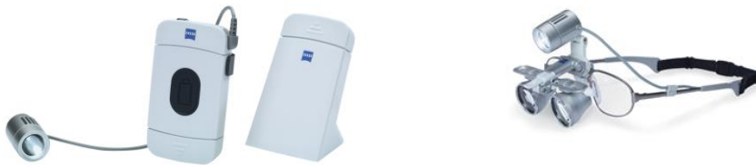
Zeiss EyeMag Smart & EyeMag Light